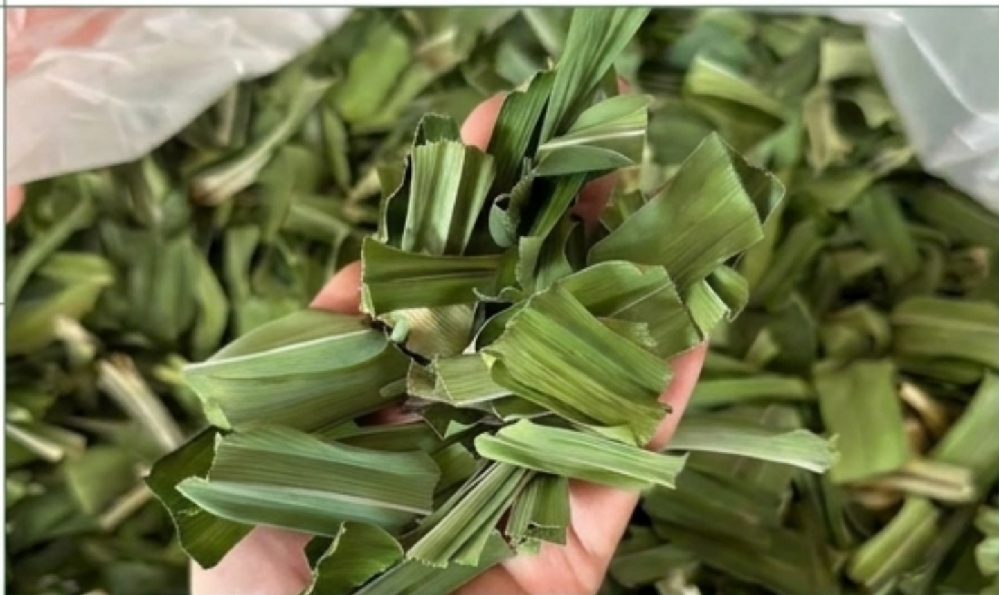
Lá Thảo Mộc Xanh (Lá Nếp / Tía Tô).