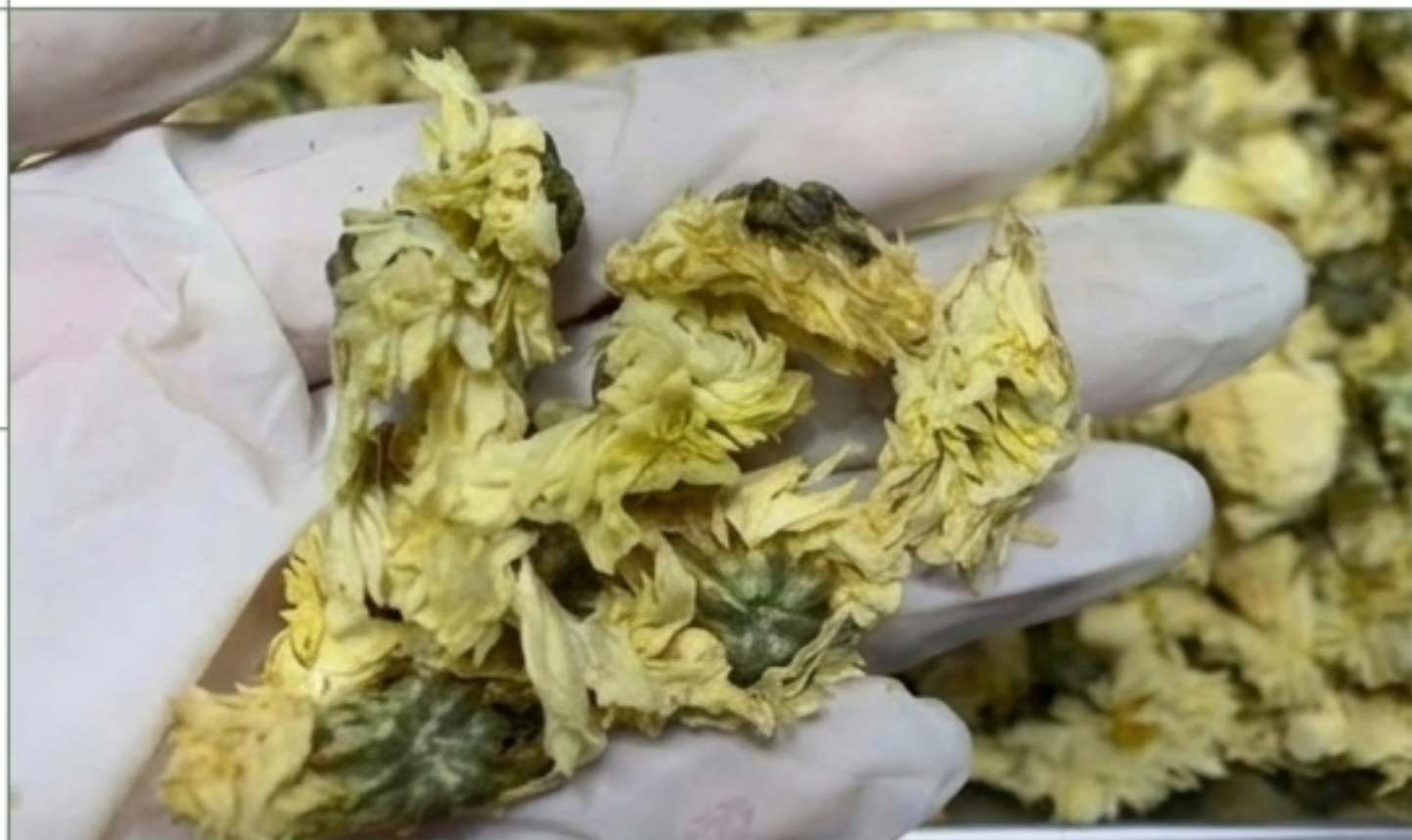
Hoa Cúc Khô Nguyên Bông.

Cắt thái đồng đều, sấy khô giữ nguyên diệp lục và dược tính.